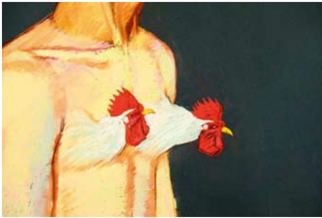
〈雙面菲克雷特〉 單頻迴圈影像 3分27秒 2012