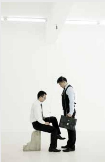
《无题》滑轮、铁索、水泥墩子、皮包 2012年

杨健的作品多与“机械”有关，展览也以此为题，而“机械”很容易让人立刻联想到“整齐、冰冷”等字眼，为了减弱这种先入为主的关联感，此次展线在安排上采用了更为柔和的弧线形，希望以此营造出一种趣味性。空白空间为杨健个展挑选的7件作品具有相当的统一性，多为2010年之后的新作，包括其在荷兰驻留期间与回国后的创作。整体看来，杨健在这两年间作品多受西方当代艺术的影响，荷兰驻留的经历在他的作品中留