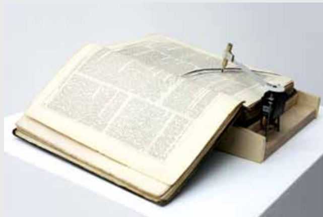
《英国古诗精选（1839）》书、马达、芯片、遥控器、木、凳子、充气水槽、铁管 2010年