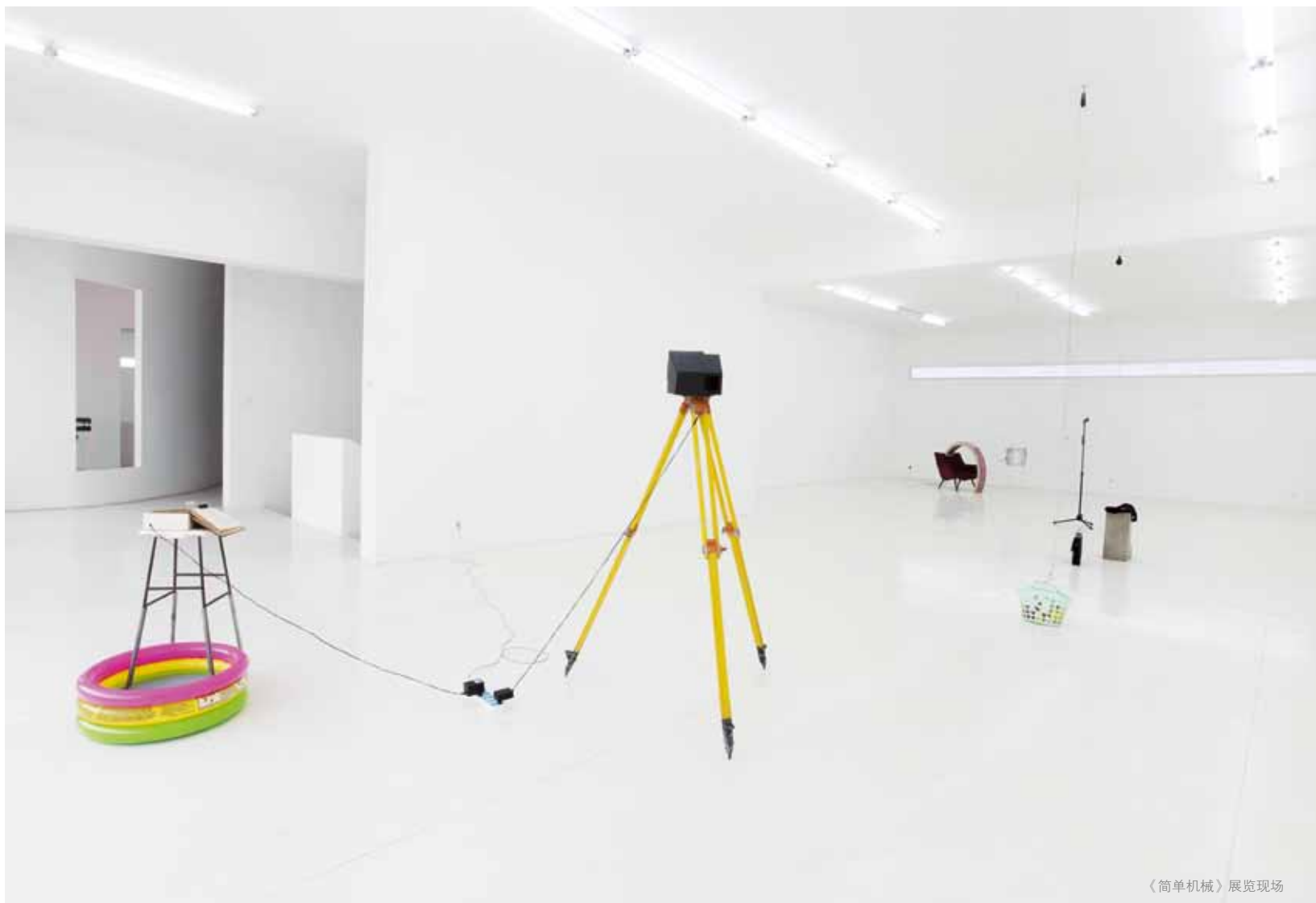
《简单机械》展览现场