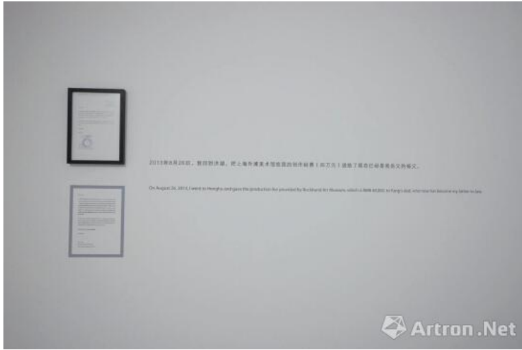
艺术是真空 2013 行为, 毛衣、遥控器、文档、录音、信函