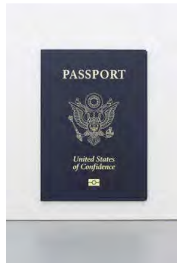
刘辛夷，《信心国民》，2016，木框、亚麻布、丙烯，300×211×5.2 cm.