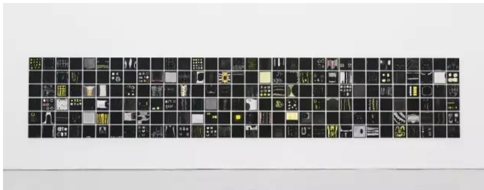
▲ 作品《我们所创造的一切都不是我们自己 192》( Everything We Create is Not Ourselves 192 )，2016，日本墨，水彩，铅笔，无酸油性笔，纸本，25x25cm，192张

Q：过去很长一段时间以来，你一直很关注对物的形态和语义进行转换。近几年你对物的认识似乎越发地内在化，甚至内在到味觉、嗅觉等对人物非常私密的体验。这种转变与你的生活经验发生变化有关吗？