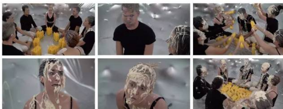
▲ 作品《August 27th》，2016，单频影像装置（彩色，有声），49' 49"

Q：从外在来看你的创作在近几年的变化是剧烈的，似乎你没有刻意追求作品表面的线索性。对你来说，创作中没有改变的是什么？