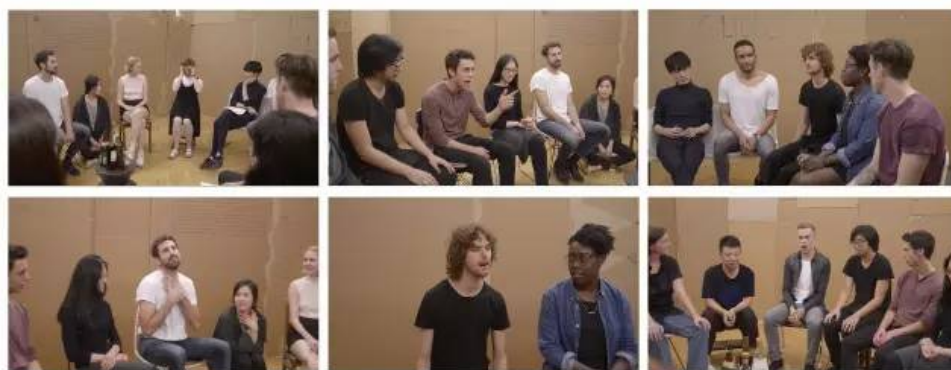
▲ 作品《July 17th》，2016，单频影像装置（彩色，有声），42' 30"

何翔宇：和生活经验没有太多关联，更多的是由创作过程内部生发出来的变化。随着创作的进行，对外部事物、内在感受的解读都会自然而然地发生转变。